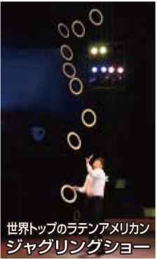
世界トップのラテンアメリカンジャグリングショー