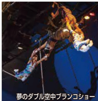
夢のダブル空中ブランコショー