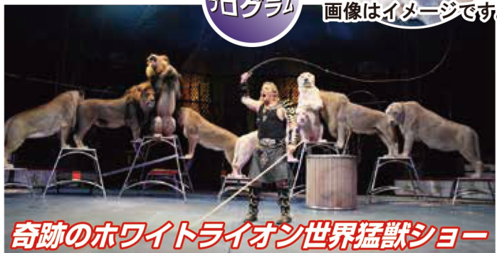
奇跡のホワイトライオン世界猛獣ショー