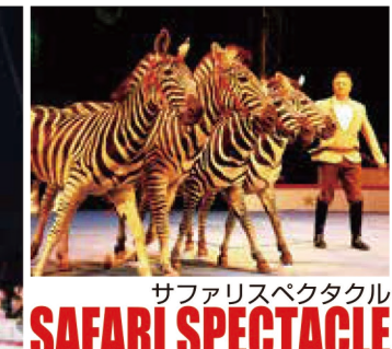
サファリスペクタクル SAFARI SPECTACLE