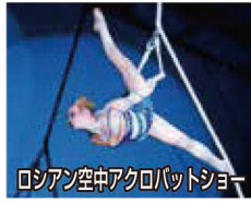
ロシア空中アクロバットショー