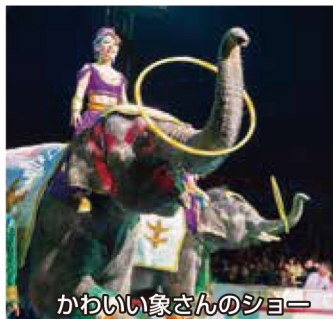
かわいい家さんのショー